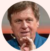
Ulrich Walter Astronaut