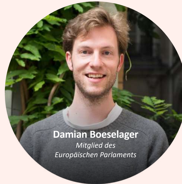
Damian Boeselager Mitglied des Europäischen Parlaments

Inspiration statt Instruktion: Lasst euch nicht sagen, was ihr machen solltet - lasst euch inspirieren, was ihr machen könntet.