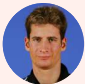
Florian Mayer Tennisprofi