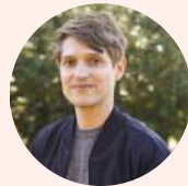
Benedict Wells Autor