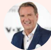
Ralf Dümmel Investor